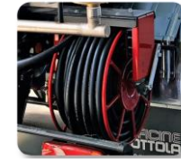
Enrouleur manuel de tuyau