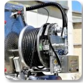
Enrouleur de tuyau hydraulique arrière