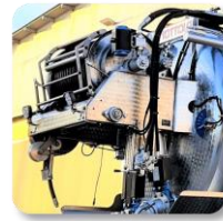
Dévidoir arrière fixe