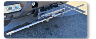
Barre de lavage avant mobile