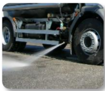
Buse de lavage latérale